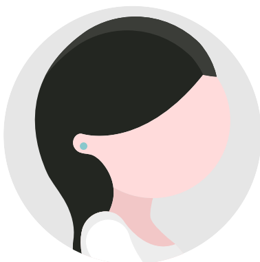
BROQUELES 1 - 3 cm

Son aros grandes con forma oval que le dan al rostro un efecto visual de alargamiento.