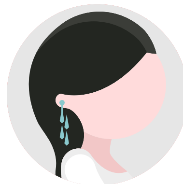
CANDELABROS 5 - 10 cm

Son pequeños y discretos. Van pegados al lóbulo de la oreja y sostenidos en la parte trasera con un broche.