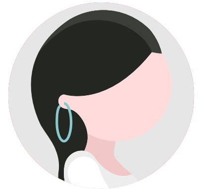
OVALES 4 - 7 cm

Cuentan con un adorno colgante y suelen ser piezas delgadas.