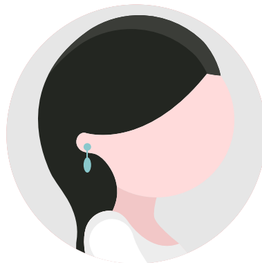
COLGANTES 3 - 7 cm

Se caracterizan por ser piezas con forma circular o redondeada unirse al final.