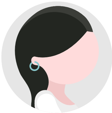
ARRACADAS 2 - 5 cm

Se caracterizan por ser piezas con forma circular o redondeada unirse al final.